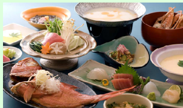
ご夕食は和食会席膳(イメージ)

客室数 120室 宴会場 大小20室 会議室 大小20室 (分科会々場多数あり)